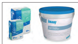
Ideal para aplicar masillas en pasta

IDEAL PARA APLICAR MASILLAS EN PASTA, PARA PINTURAS INTUMESCENTES Y PINTURAS IMPERMEABILIZANTES