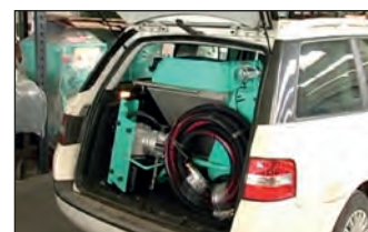
Gracias a su reducido tamaño y peso, es muy fácil y cómoda de transportar.